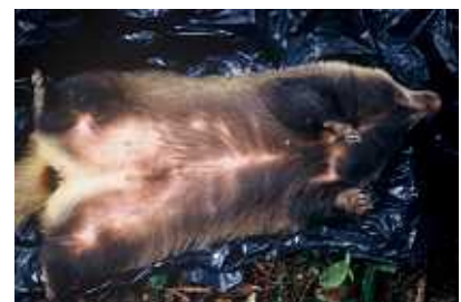
冬眠直前のアナグマ、脂肪が体全体についている