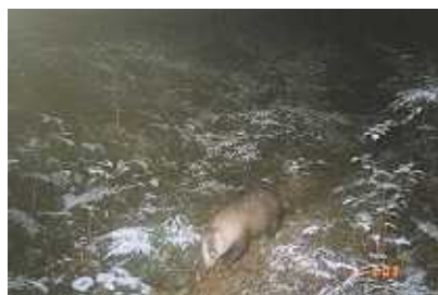
12月、体重が最も増えているところのアナグマ