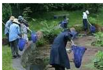
6月24日 浮き草の除去