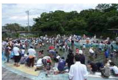
6月10日 ヤゴ救出作戦