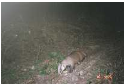
6月、体重が最も減少しているところのアナグマ

身近な生物たちの暮らしを丹念に追いつけていると、毎日新たな発見があります。発見があるとさらにおもしろくなります。私たちのまわりには好奇心を満足される宝の山がたくさんあります。フィールドで、日常の暮らしの中で、発見する喜びと謎を解き明かす楽しみを味わってください。私たちの身の回りには、注意深く観察すると自分が今まで見たことのない生物を発見できるはずです。