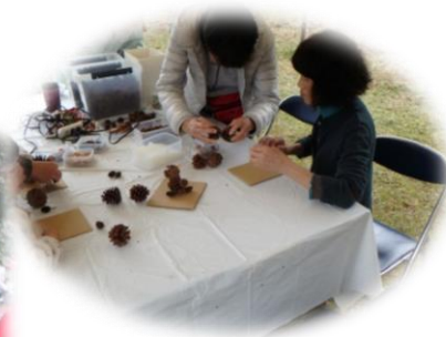
楽しいワークショップ!