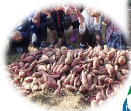
里山の美味しい恵み♪