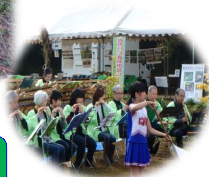
里山の美しい響き♪